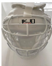
マーシャルワールド用