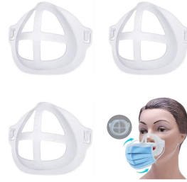
マスクインナーパッド

マスクを付けても呼吸はしやすくなります。 通販などで、色々な種類のものがあります。