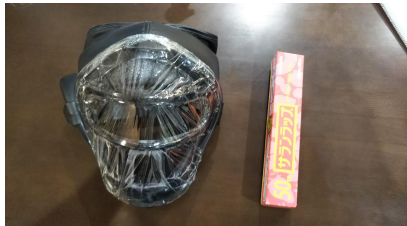
サランラップと 透明のテープでの取り付け例